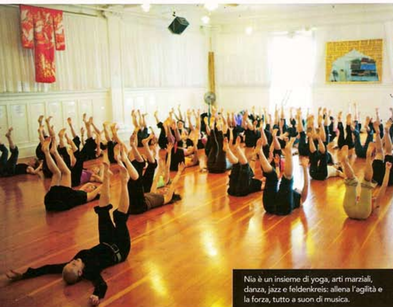
Nia è un insieme di yoga, arti marziali, danza, jazz e feldenkreis: allena l'agilità e la forza, tutto a suon di musica.