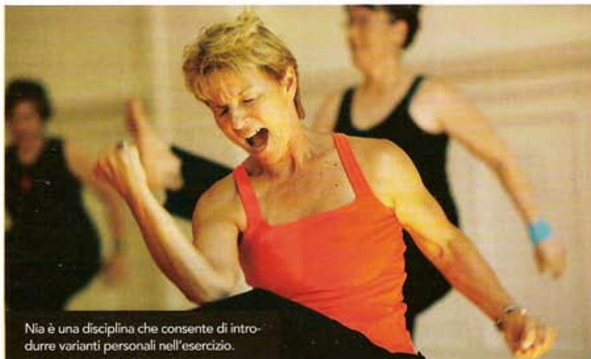
Nia è una disciplina che consente di introdurre varianti personali nell'esercizio.